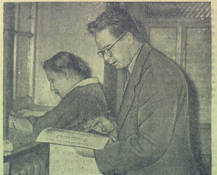
СВЕЖИЙ НОМЕР ГАЗЕТЫ!