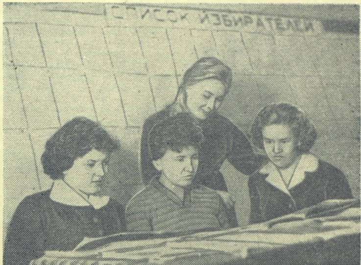
Горячая пора сейчас у филологов V курса. Одни работают над дипломом, другие готовятся к экзаменам. Но они находят время и для того, чтобы просмотреть свежие газеты и журналы.

18 марта — день выборов в Верховный Совет СССР. Отдадим свои голоса кандидатам блока коммунистов и беспартийных.