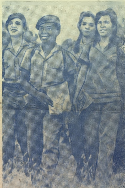
Вот они, бригадисты.

Три месяца назад они были «чистенькими», а неделю назад я собрала их письма (по заданию) маме, сестре, другу и в большинстве прочла следующее: «Дорогая мама! Я пишу мало, потому что изучаю много. Фидель говорит, что молодежь должна всегда идти вперед и изучать, изучать, изучать. Имя моя учительница —