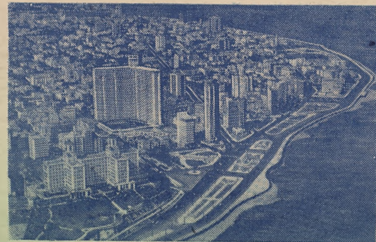
Общий вид Гаваны с моря.

очень много... Вчера дала три урока русского языка. У меня около 30 студентов-юношей, есть несколько негров. Можете себе представить, я не знаю испанского, а они русского языка. Теперь поняла смысл фразы, сказанной мне в ЦК партии: «Самый лучший учитель русского тот, кто