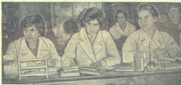
Химики-вечерники I курса на занятиях по аналитической химии.

Это лишь отдельные штрихи. Борьба же за честь университета должна проявляться во всех больших и малых делах.