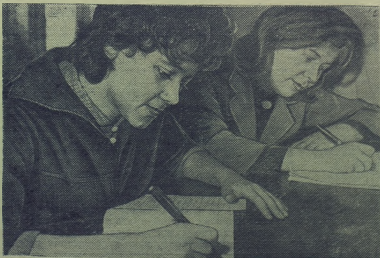
У биологов II курса лекция.