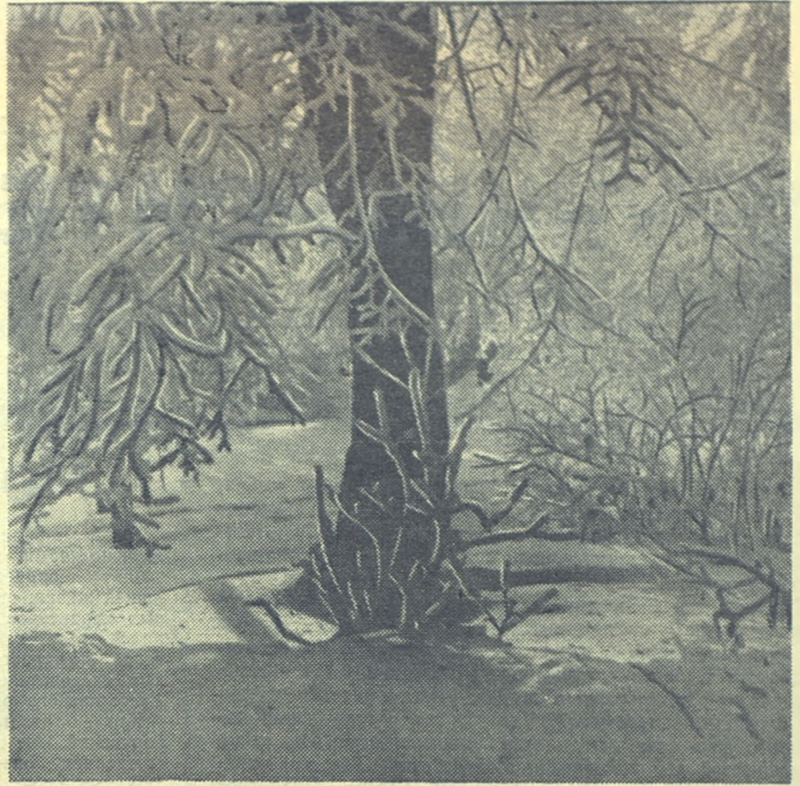
Хороша уральская зима!