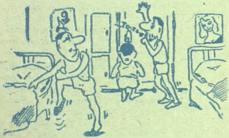
КАРАУЛ! РЕЙД УЧЕБНОЙ КОМИССИИ. Рис. Н. Шуклина.

● ... Рейд по общежитиям, общественные смотры групп, работа академкомиссий, работа со старостами — вот дела комитета по улучшению учебы. Учебная комиссия физиков во главе с Н. Мотяз стала грозой для прогульщиков. Ведь не зря, узнав о рейде, комната № 9 девятого общежития закрывалась на ключ — висеть в «молнии» всё-таки стыдно.