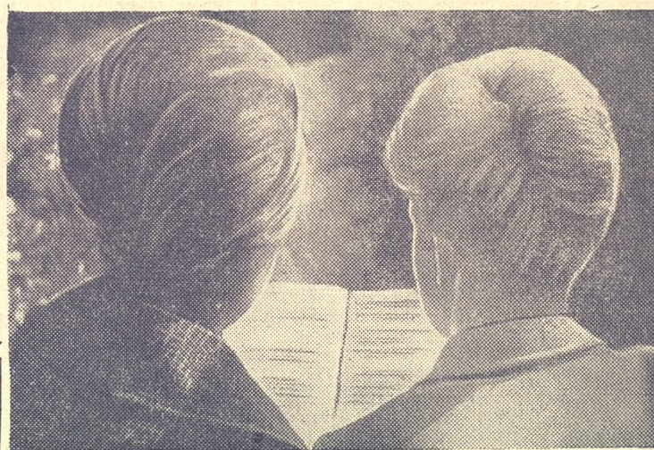
Не до соловья.

Библиографический указатель литературы по механизации учета и вычислительных работ (1954—1963 гг.) М., 1965, 271 стр. В нем собрана основная литература по механизации учета и вычислительных работ, изданная в СССР за последние 10 лет. Здесь нашли отражение книги, брошюры и статьи, написанные