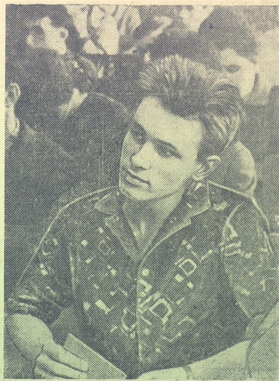
На собрании физиков.