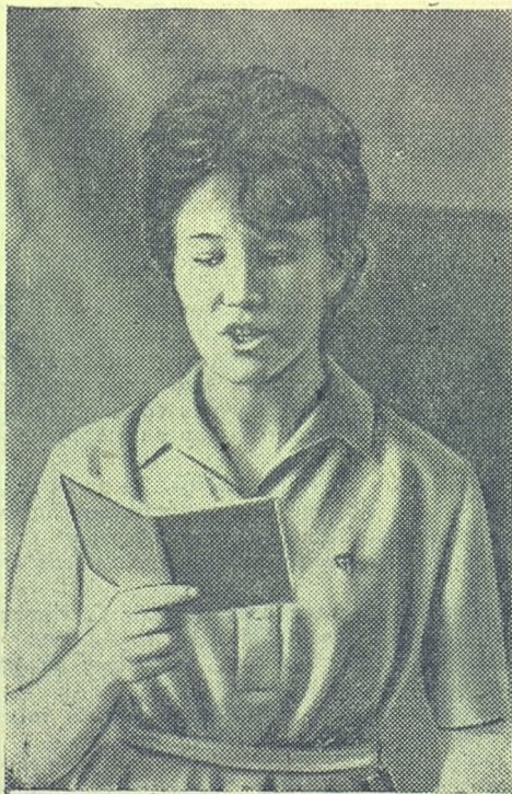
Звучат слова из устава целинника.

«Дистен» — нет, в данном случае не минерал, а название отряда целинников, в котором основная масса — геологи-первокурсники.