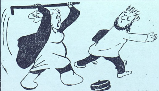
Нашим вахтерам не хватает нежности.