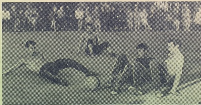
Новый вид спорта: футбол на четвереньках.