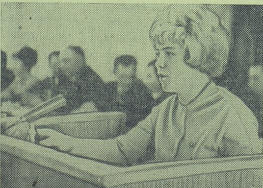
Комсомольский секретарь отчитывается.

— Отчетный период прошел под знаком подготовки к 50-летию Великой Октябрьской социалистической революции и 50-летию университета. В своей работе комитет стремился устранить недостатки и выполнить указы комсомольцев, отмеченные в решении XVIII конференции. Особое внимание комсомольские организации факультетов обращают на правильную организацию учебно-воспитательной работы студентов. Ра-