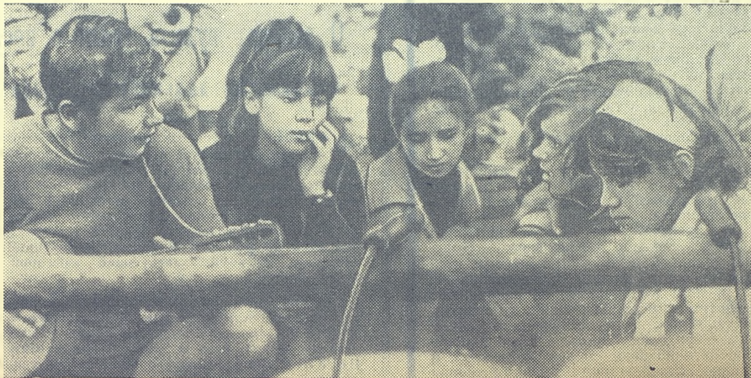
— Прощай, колхоз, прощай, студенческое лето!