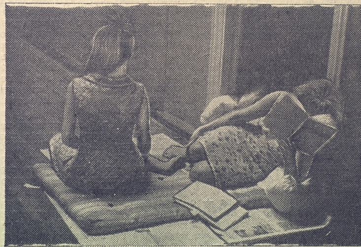
Когда часы пробили полночь...