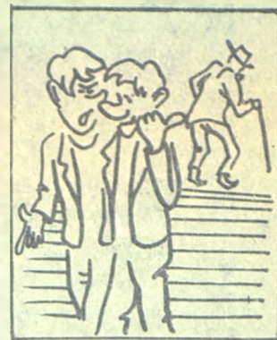
— ЗНАКОМОЕ ЛИЦО... — ЭТО ЖЕ НАШ ПРЕПОДАВАТЕЛЬ!