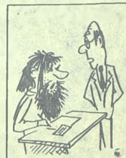
— КАК?! ВЫ ДО СИХ ПОР НЕ ГОТОВЫ?!...

Я возвращаюсь в комнату, где две трети населения лежат, сраженные сном и усталостью, беру пишущую машинку и, шестой, присоединяюсь к компании в чи-