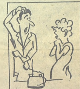
— СКАЗАЛИ: ЕСЛИ Я НЕ ПОСТАВЛЮ ТРОЙКУ - ОТКЛЮЧАТ СВЕТ.