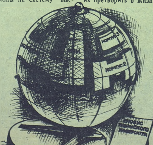
Рис. Владимира Ивашкина.