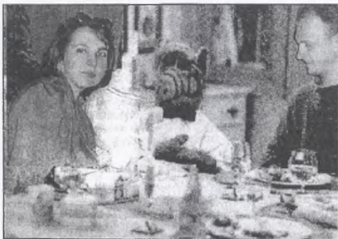
Альф в гостях у редакции.