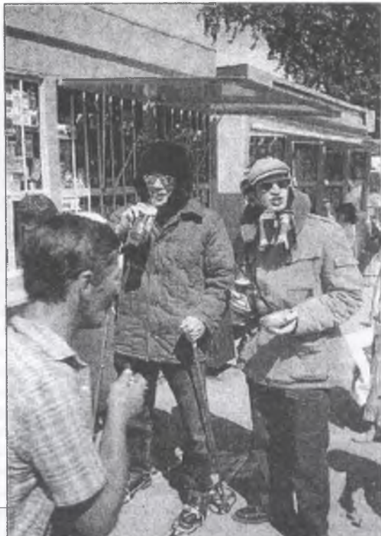
Лыжный забег в честь Дня независимости.

музыкального училища начинают серию концертов «ВЕЧЕРА СОВРЕМЕННОЙ МУЗЫКИ». Первый концерт состоится 13 апреля в зале музыкального училища (Большевицкая, 71). Прозвучат произведения немецкого композитора Пауля Хиндемита.