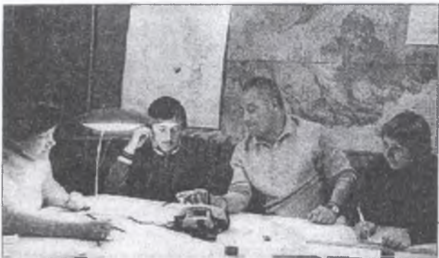
В лаборатории со студентами.

Если мог кому-нибудь помочь, никогда не отказывался, а взваливал на себя чужие проблемы и не считал, что это ему в тягость.