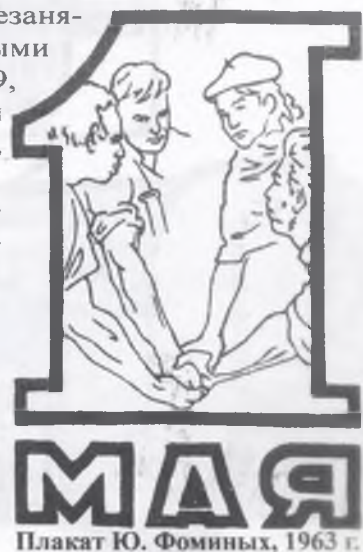
Плакат Ю. Фоминых, 1963 г.

ПОЗДРАВЛЯЕМ ДОРОГИХ ВЕТЕРАНОВ С ДНЕМ ПОБЕДЫ! ЖЕЛАЕМ ЗДОРОВЬЯ, МАТЕРИАЛЬНОГО БЛАГОПОЛУЧИЯ И ВНИМАНИЯ СО СТОРОНЫ БЛИЗКИХ, РОДНЫХ И КОЛЛЕГ!