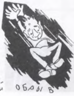
ОБ ОДИ В