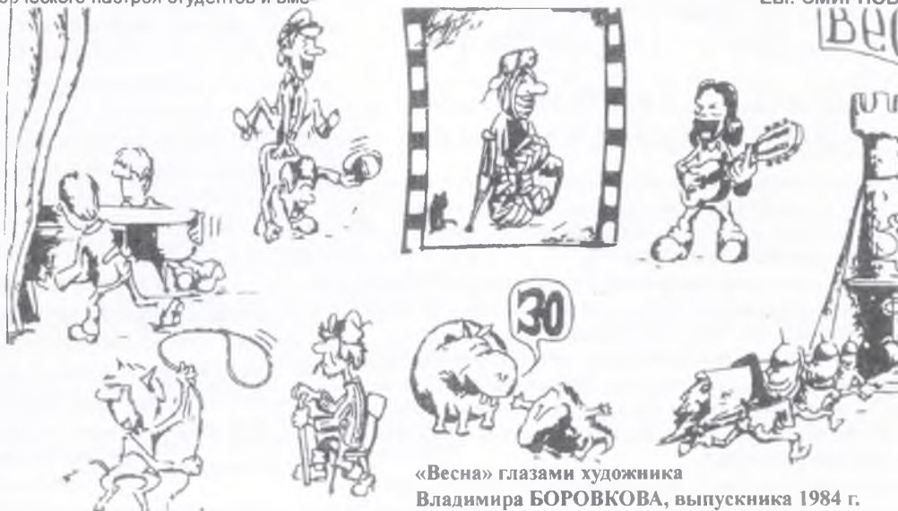
«Весна» глазами художника Владимира БОРОВКОВА, выпускника 1984 г.