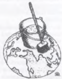
Рис. Р. Казанцева.

В конце апреля традиционно проходят «субботники» по благоустройству территории ПГУ. Призываем всех активнее включаться в это нужное дело. Сделаем наш городок краше и чище. А главное - сохраним эту чистоту!