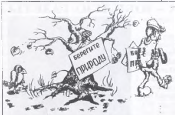
Рис. В. БОРОВКОВА, выпускника геологического ф-та.