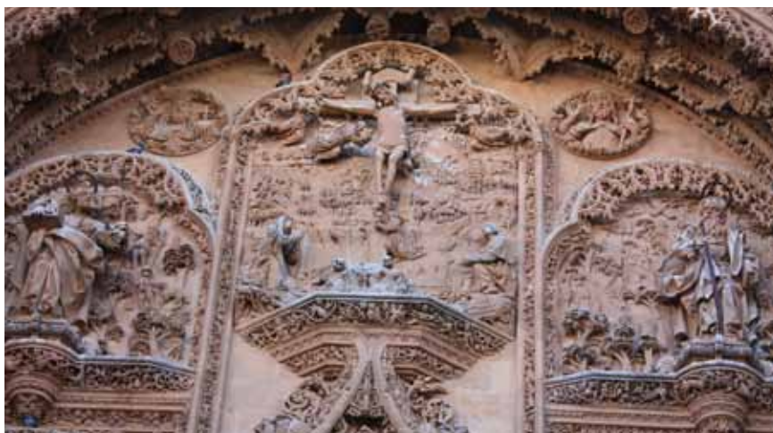
Новый собор. Деталь главного входа