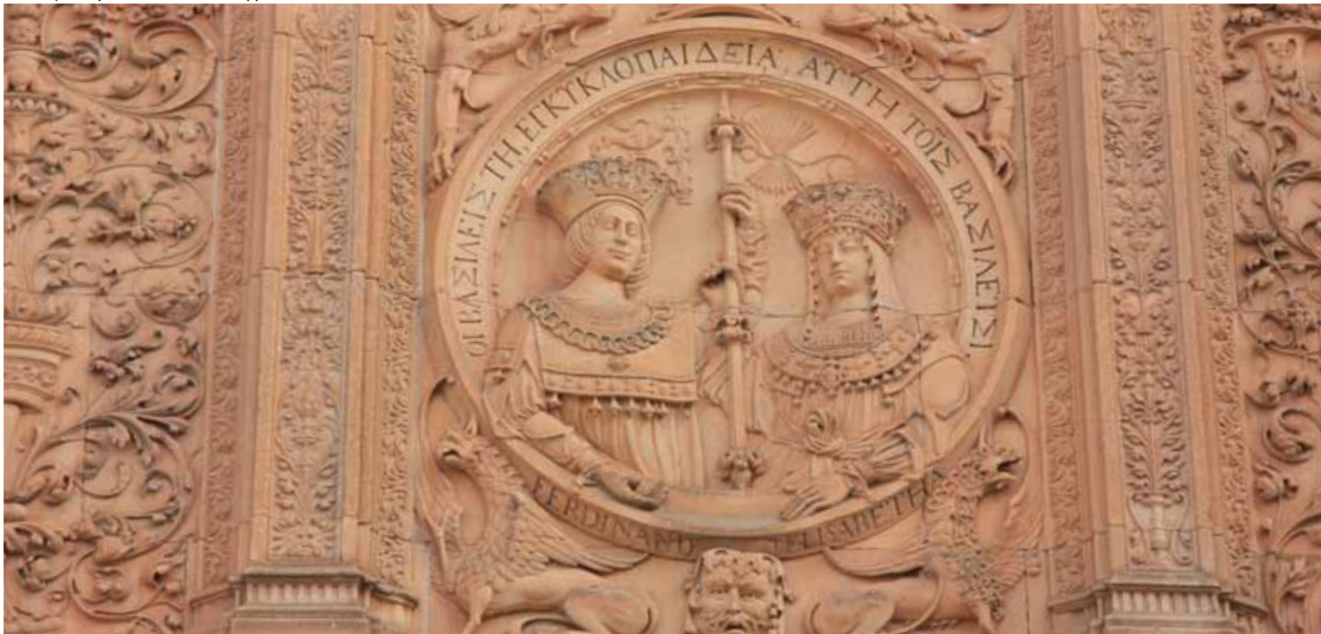
Фасад университета. Нижний фриз