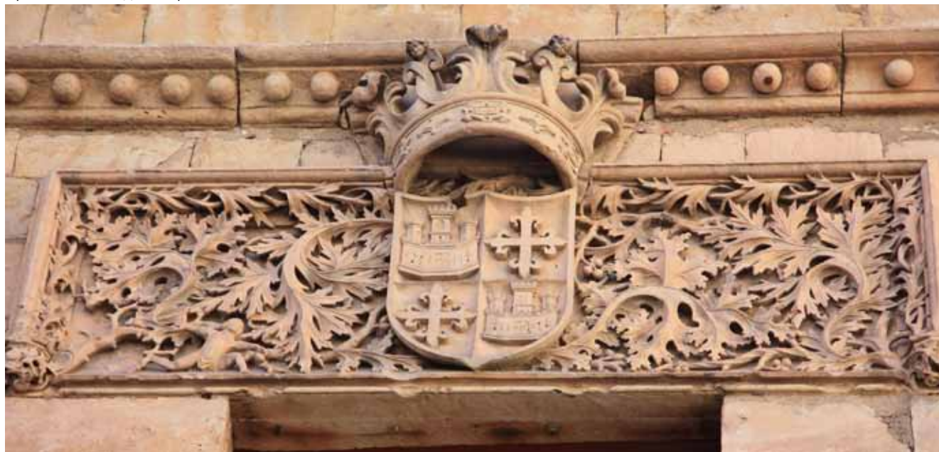
Городской особняк. Деталь фасада

Вторая причина ехать в Саламанку – тоже университет. Один из четырех древнейших в Европе наряду с Болонским, Оксфордом и Сорбонной, он и сегодня славен как центр изучения испанского языка. Только Саламанка может выдавать государственный