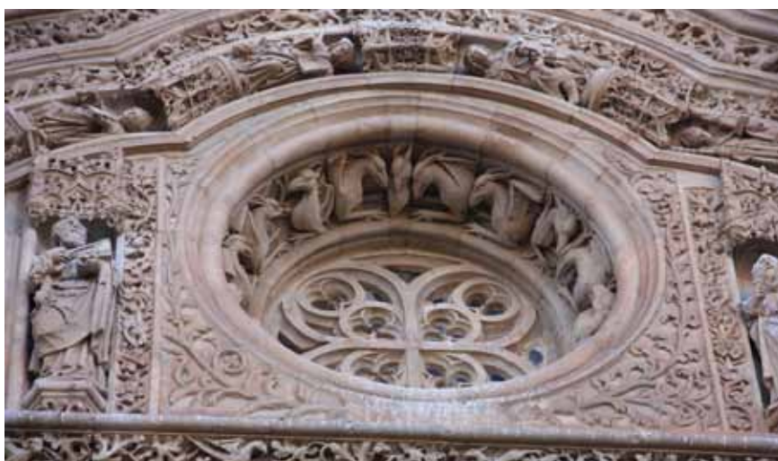
Новый собор. Деталь северного портала

диплом испанского как иностранного – D.E.L.E. Это то же, что для английского IELTS, в США – TOEFL, а для немецкого GDS. За классическим испанским сюда и едут со всех концов света. Поэтому Саламанка с ее 30 тысячами студентов на 150 тысяч жителей, как и в средние века, остается городом юности.