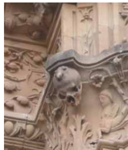
Лягушка на черепе. Фасад университета

ИЗВЕСТНО , что университетский фасад был завершён в 1533 году, но кто автор этого шедевра,