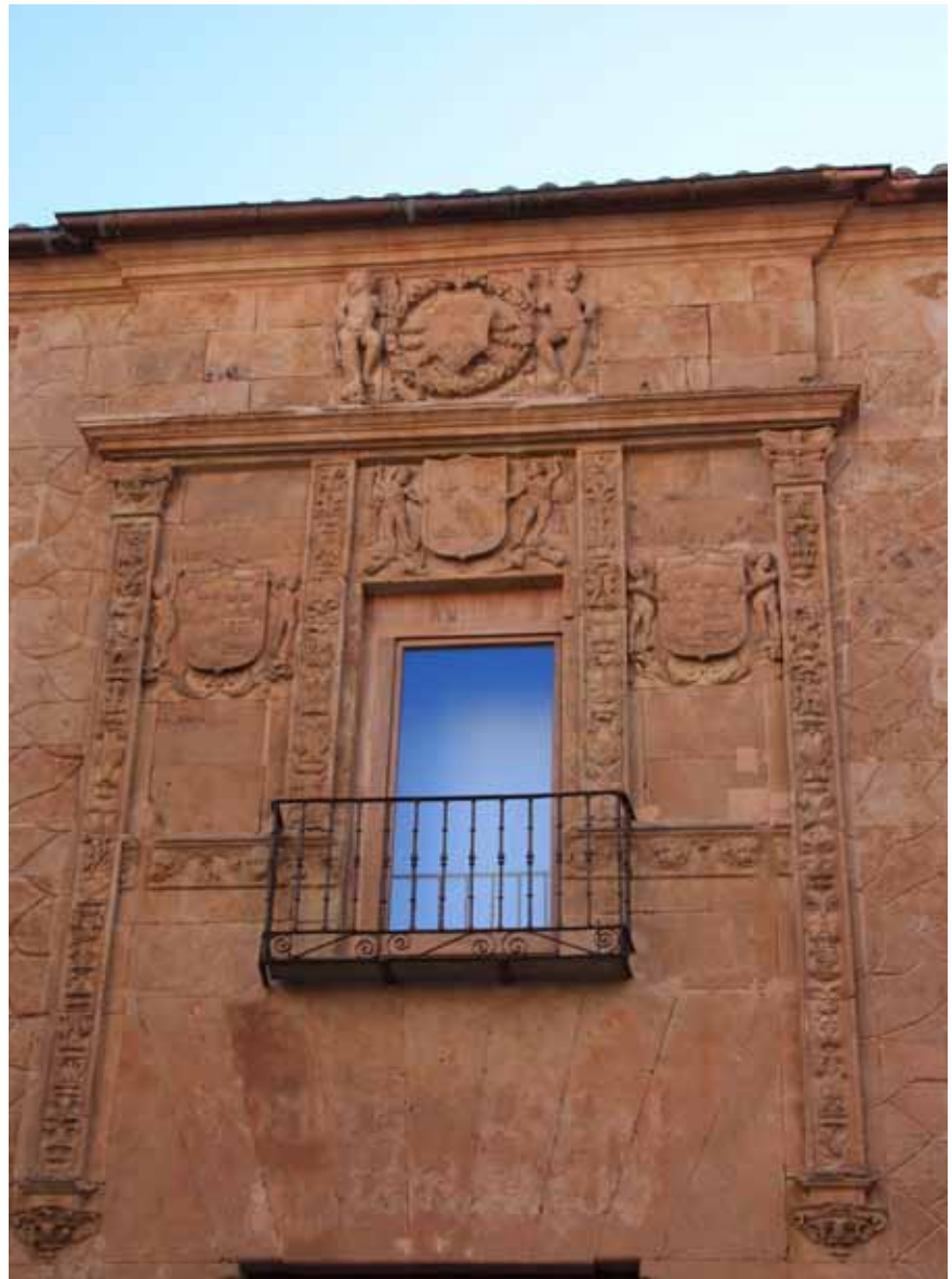
Фасад городского особняка

ГРОМАДНАЯ плоскость портала, фланкированная пилястрами и разделенная по вертикали на три ленты фриза, сплошь покрыта резьбой. Это ковер из камня, в завитках которого теряется и кружится глаз. В центре нижнего фриза большой круглый медальон с профилями католических королей – Изабеллы и Фердинанда.