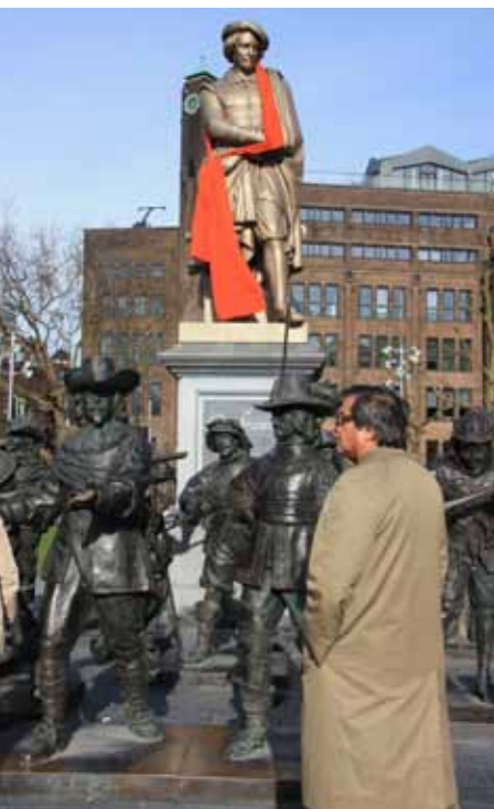
На площади Рембрандта

Что радикально отличает Амстердам от всех иных европейских столиц, так это отсутствие пафоса. Никакой напыщенности, никакого парада, никаких ностальгических игр в империю. А ведь была она, империя. Голландия XVII-го золотого века, хозяйка морей, центр мировой торговли. И — кажется — никакой иерархии и почтения к фасадам. Взять королевский дворец на площади Дам. Он изначала не блистал пышностью форм, скромный такой, но лидеры молодежных протестных движений 1960-х всерьез бились за то, чтобы превратить его в «Коллективный храм Санта-Клауса» и уступить сквоттерам — бездомным, самовольно заселяющим пустующие здания. Королева живет в Гааге, а дворец стоит без дела. Непорядок. Даешь молодежь!