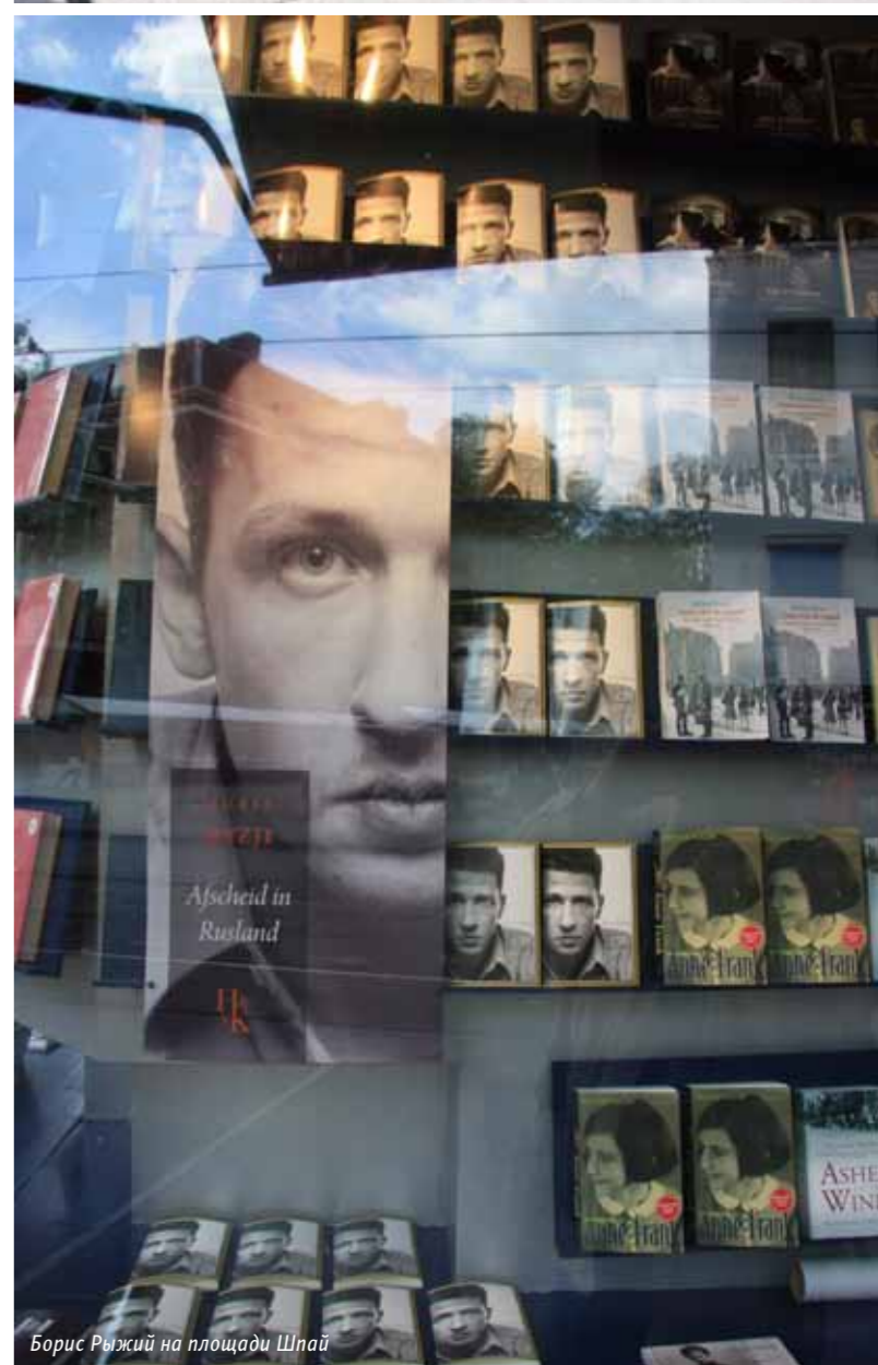
Борис Рыжий на площади Шпай