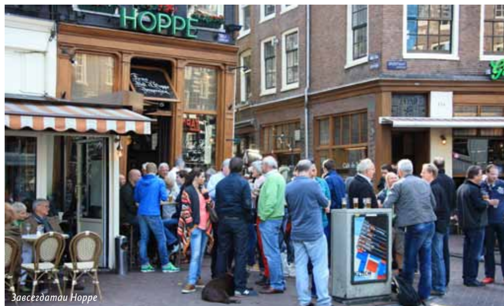
Завсегда ии Норре

Вот так и строится Амстердам из чередования водоворотов шумной жизни и зеленых пауз тишины. Уедешь куда-нибудь на окраину в Осдорп, в район Слотерпарка, а там на берегах зеленых каналов стоят размышляющие цапли, по газонам катаются ушастые круглые кролики, и тихие люди что-то без конца холят в своих миниатюрных садах. ☺